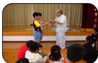
昔遊び(こま作り)の指導