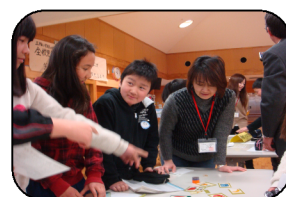
小学校での英語学習支援

ちくぜんボランティア講師として、学習指導・体験活動の支援をしていただける方を募集しています！