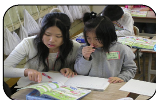
学生サポーターによる教科指導