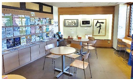
8年連続貸出冊数日本一 基山町図書館内のキャマラウンジ

生涯学習課長 令和7年度はリラックスして本が読めるよう、蓋つきの飲み物を飲めるようにした。令和8年度は新規事業として電子図書館を導入する。ボードゲーム等のイベントを充実させ交流の場としての在り方を研究していく。