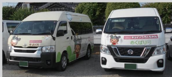
チョイソコちくちゃん

【特典】 本祭(11月2日)の運賃が無料！ 利用するには事前登録と予約が必要です。 ※会場特設ブースで登録をお手伝いします。 ※特典の予約は1週間前から、電話のみ！