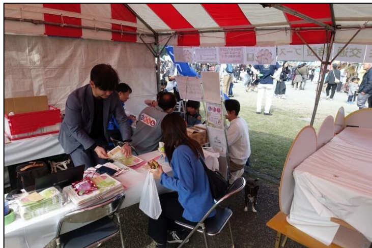
【西鉄バスの展示・乗車体験の様子】