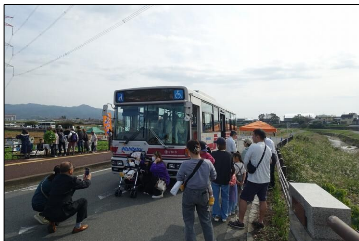
【西鉄バスの展示・乗車体験の様子】