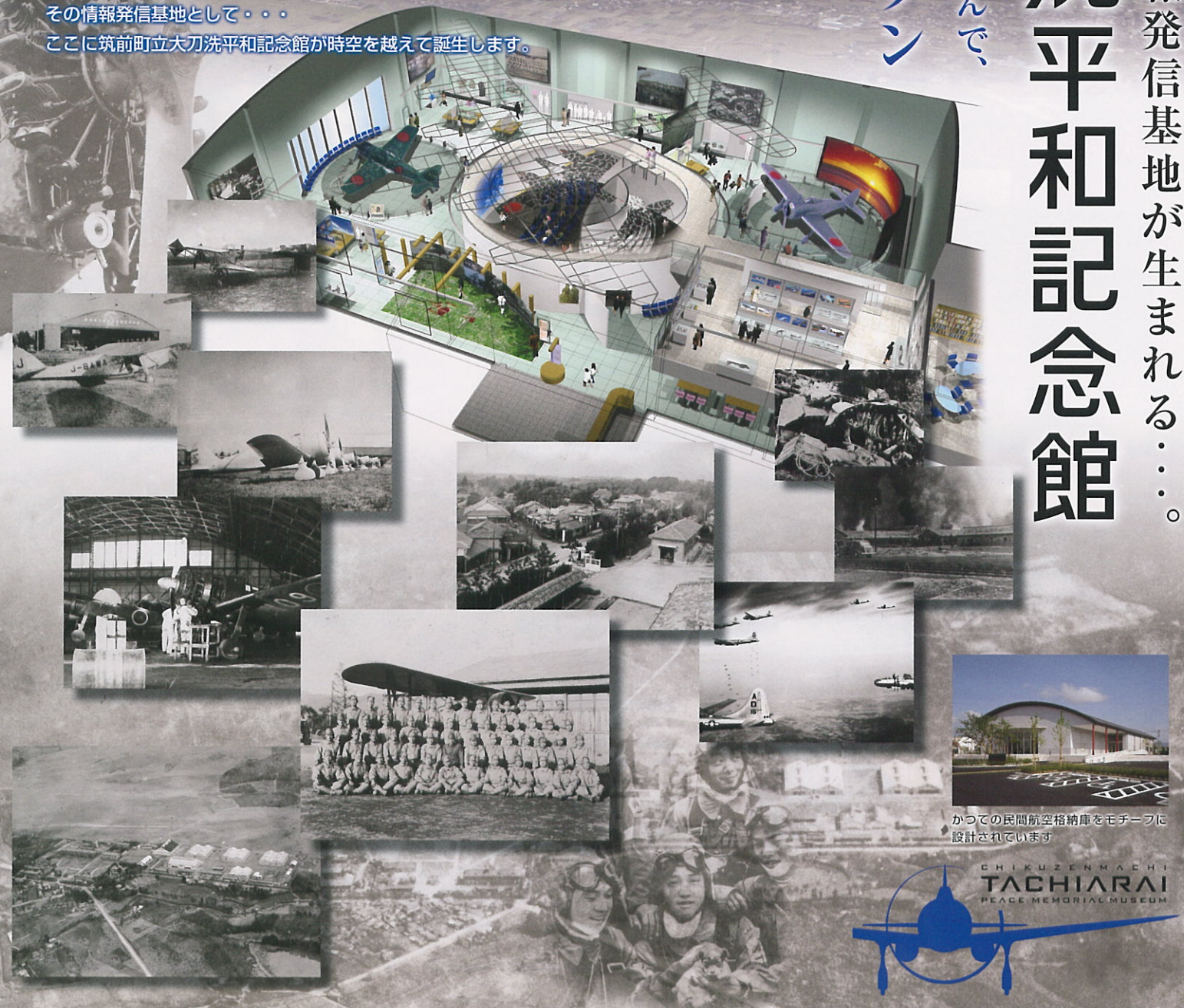
かつての民間航空格納庫をモチーフに設計されています

この地で起きた歴史の真実と、平和の大切さを、 国を背負って立つべき青少年に永久に語り継いで行くために、 その情報発信基地として…… ここに筑前町立大刀洗平和記念館が時空を越えて誕生します。