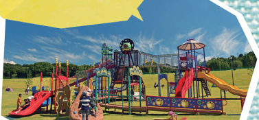
筑前町多目的運動公園ぼぼろ

福岡県内町村の中では、なんと都市公園数トップ！町内にはのびのびと遊べる公園がいっぱい。