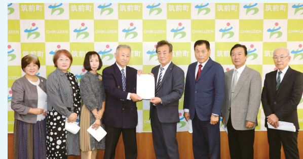
意見書を提出する委員のみなさん

筑前町政治倫理条例により、町三役と町議会議員は、資産等報告書の提出が義務付けられています。町政の担い手である町三役や町議会議員が、自己の地位を不正に利用したり、自己の利益を図ったりすることなく、町全体の代表者として公正で開かれた民主的な町政の発展に寄与することを目的としています。審査会は10月9日に町長へ審査意見書を提出しました。