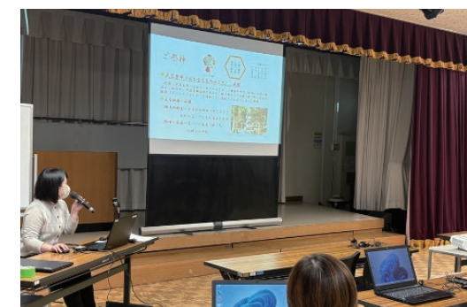
▲受講生によるプレゼンテーション

11月22日㊥、29日㊥、12月6日㊥の全3回で、就業や転職、スキルアップを図りたい方を対象に、パワーポイント講座を開催し13人が受講しました。基礎から学び、写真やイラストを入れた資料を作成しプレゼンテーションを行いました。参加者からは、「難しいのではと構えていたが、やってみると楽しく、自分にもできた」「自信がついた」などの意見があり、実践に活かせるスキルを習得されました。また、ワーク・ライフ・バランスのミニ講座を通して自身の生活と時間の使い方について振り返ることができました。