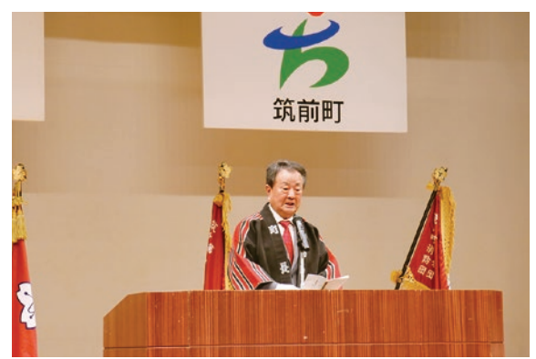
筑前町消防出初式